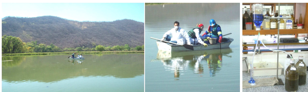
Figura 3. Izquierda y centro: toma de muestras de lodos en las lagunas de estabilización. Derecha: medición de gas metano por el sistema de desplazamiento de líquido.