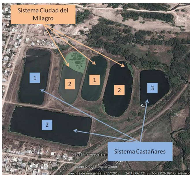
Figura 1. Ubicación de las lagunas de estabilización del sistema Castañares-Ciudad del Milagro. 1: Lagunas anaeróbicas; 2: Lagunas facultativas; 3: Lagunas de maduración.

Las LDE estudiadas en este trabajo se encuentran emplazadas en la zona Norte de la ciudad de Salta, cerca de la intersección de los ríos Vaqueros, Wierna y La Caldera, que luego forman el río Mojotoro. Estas lagunas fueron diseñadas para tratar los líquidos cloacales de los barrios Ciudad del Milagro, Universitario y Castañares (Da Silva Wilches, 2001; Liberal et al. , 1998; Arenas, 2010). El sistema puede ser dividido en dos sub-sistemas integrados por tres lagunas cada uno ( Figura 1 ). En el diseño original estaba previsto que cada sistema contenga una laguna anaeróbica, una facultativa y una de maduración. Por cuestiones operativas, la laguna de maduración del Sistema Ciudad del Milagro se opera como una segunda laguna facultativa (ver configuración de ambos sistemas en la Figura 1 ). El predio circundante a las LDE se encontraba totalmente deshabitado en un radio de aproximadamente 800 m al momento de su puesta en funcionamiento. Debido a la expansión demográfica que experimentó esta zona en los últimos años, y por problemas de planificación urbana, la planta de tratamiento fue rodeada por asentamientos poblacionales que se fueron consolidando paulatinamente. Los barrios más próximos a las lagunas son: Juan M. de Rosas (2918 habitantes), 17 de Octubre (3670 habitantes) y La Unión (2153 habitantes) (CoSAySa, 2012).