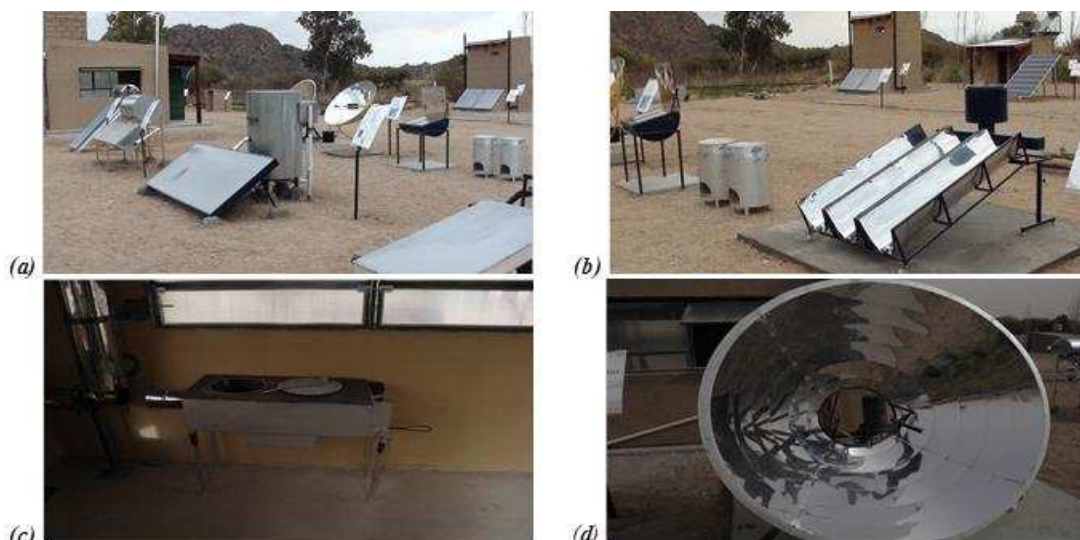
Figura 3: Aparatos e instalaciones del módulo cocina

El módulo de cocina se refiere a un sector destinado para la realización de prácticas culinarias con distintas alternativas tecnológicas. Por este motivo, se instalaron distintos equipos (cocinas) que permitan realizar la cocción de alimentos a partir de energía solar. Se dispone de un horno concentrador, cocina concentradora de 2 m 2 , 2 modelos de cocinas concentradoras de 1 m 2 , una cocina tanque, una cocina con CPC y 2 braseros de alta eficiencia y bajo consumo, con capacidad para ollas de 20 y 50 litros, Fig. 3a y b. Dentro del módulo de cocina se instaló, una cocina ahorradora de leña, que pueden utilizarse simultáneamente para producción de agua caliente. La misma se encuentra en el interior de un local, Fig. 3c. Dentro de este mismo local se encuentra un pasteurizador de leche que utiliza como fuente de calor un concentrador solar que se encuentra en el exterior. Fig. 3d