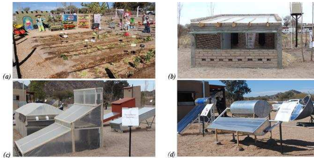
Figura 2: Instalaciones del módulo de producción familiar

Para la producción de agua caliente se instalaron cuatro tipos de calefones con diferentes diseños de colectores solares y con distintas capacidades. En la Fig. 2d, se muestran un calefón tipo tubo y uno del tipo CPC.