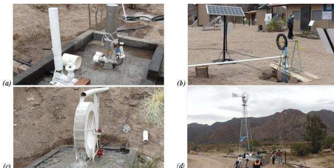
Figura 4. Instalaciones del módulo de agua

Con respecto al módulo agua , Fig. 4, se colocaron diferentes equipos para el bombeo de agua, tales como bombas de ariete (a), bombas de soga (b), ruedas hidráulicas (c) y molinos de viento (d). Para el almacenamiento de agua para riego y para consumo humano se instalaron bebederos, un tanque australiano, cisternas y represas demostrativas con diferentes técnicas de impermeabilización. Se muestran en este módulo los diferentes sistemas, presurizados y por gravedad.