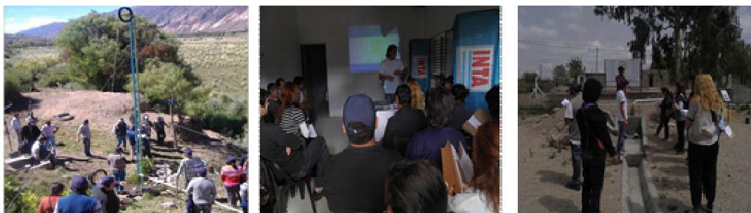
Figura 6. Actividades desarrolladas en el CDT - Belén

contar con una planta permanente de guías, que puedan realizar de manera dinámica la recorrida por las distintas alternativas tecnológicas, se dictaron talleres de capacitación al personal municipal.