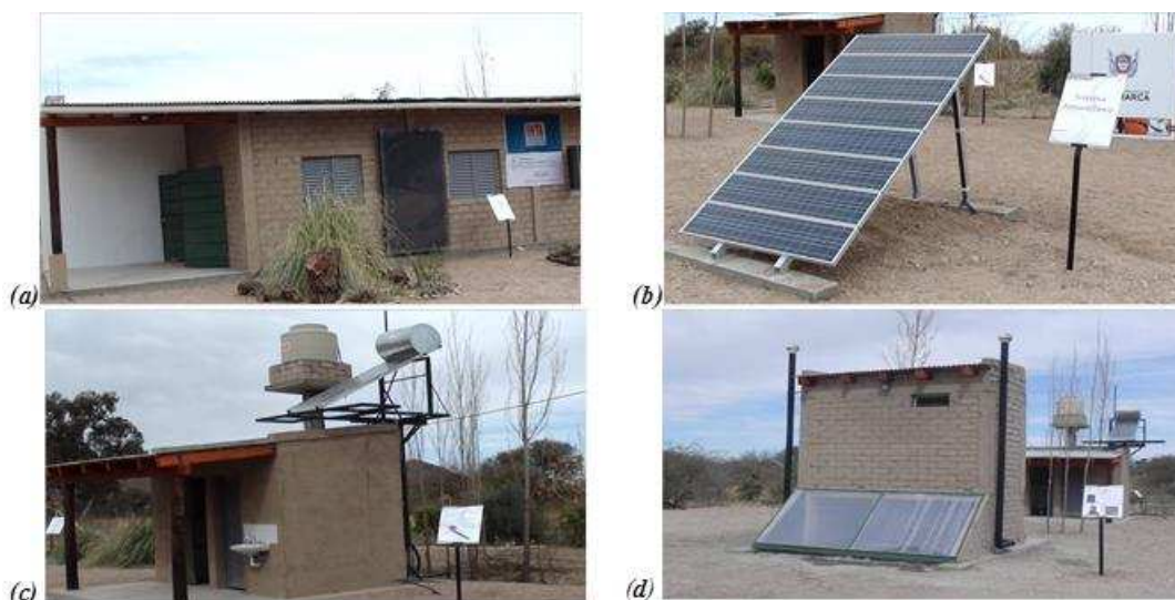
Figura 1: Instalaciones del módulo de servicio

El módulo de servicio está conformado por un salón de usos múltiples (SUM), que está concebido desde un punto de vista de ahorro de energía convencional. Está construido con material de suelo cemento; posee un colector solar de aire en una de sus paredes, para calefaccionar el ambiente. La Fig. 1a muestra el SUM con el colector solar de aire en su pared norte. Para la generación de electricidad dispone de paneles fotovoltaicos, Fig. 1b. Los baños húmedo y seco, destinados al uso del personal del CDT y de los visitantes contemplan conceptos de arquitectura bioclimática. El baño húmedo tiene provisión de agua caliente mediante equipos de aprovechamiento solar, sistemas de tratamiento de aguas negras y tratamiento de aguas grises, Fig. 1c y d. También se ha instalado una estación meteorológica que permite obtener datos climáticos del lugar.