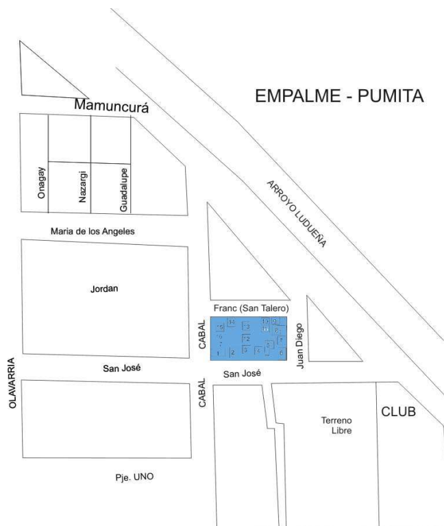
Figura 1: Mapa esquemático del barrio donde fue desarrollado el estudio, se indica la manzana donde la encuesta fue aplicada.

realizadas en el período de noviembre a diciembre de 2010. La aplicación de cada encuesta tuvo una duración de aproximadamente treinta minutos.